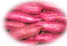
サツマイモ病害虫