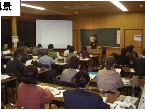
経験豊富な講師による講義