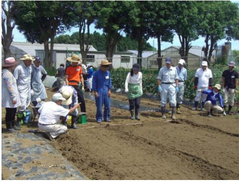
作物づくりを学びます