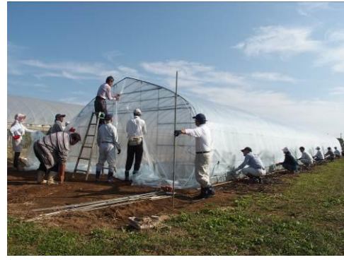
パイプハウスづくりも学べます