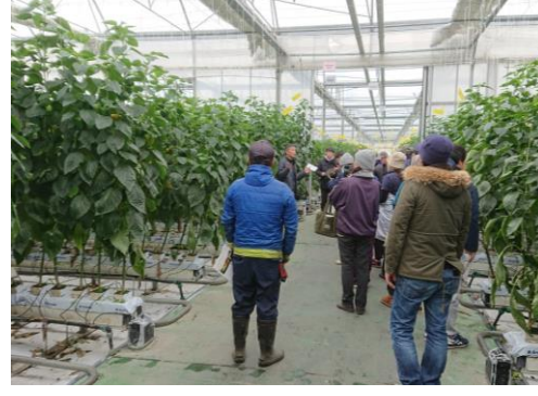
先進農家や市場で見学