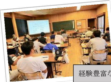
経験豊富な講師陣