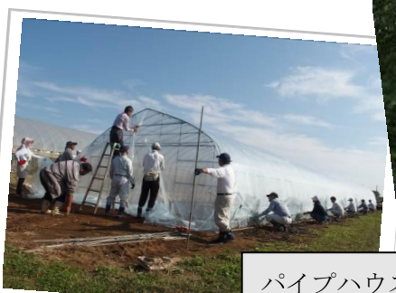
パイプハウスづくり