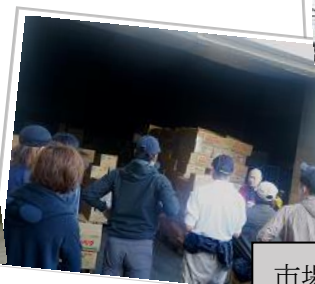
市場や先進農家視察