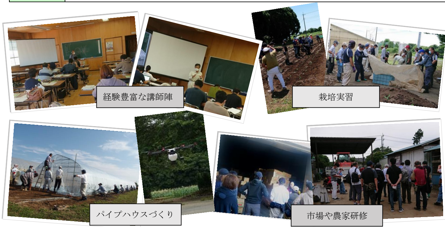
経験豊富な講師陣